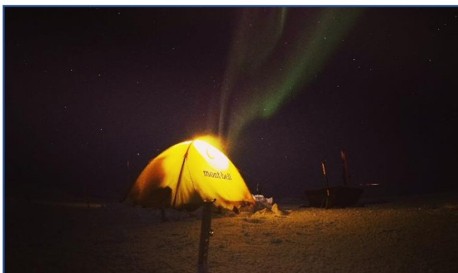
2020年/海氷上でのオーロラ