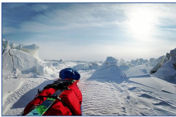
2020年/訓練で乱氷帯を抜ける