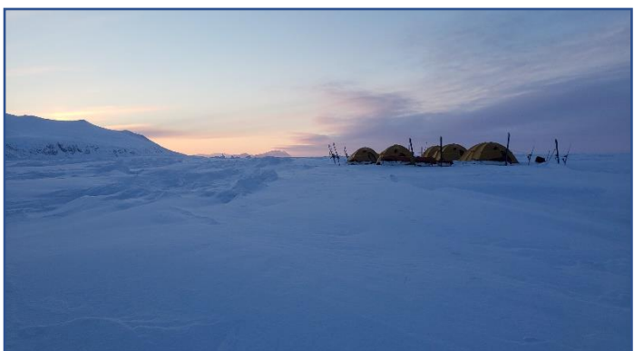
2019年/海氷上での夕焼け