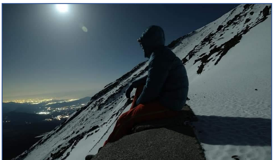
2021年/富士山7合目キャンプ地にて