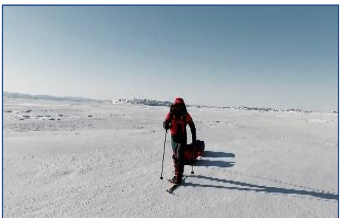
2020年/橇を引いて歩く私