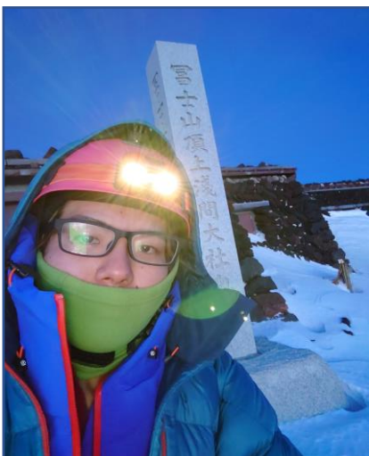
2021年/富士山吉田口頂上にて