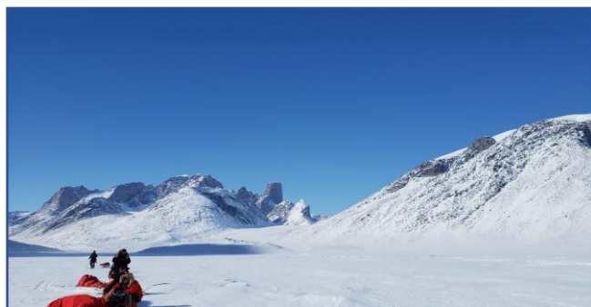
2019年/円柱状にそびえたつアスガルド山