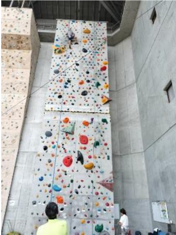
げんき村の人工壁