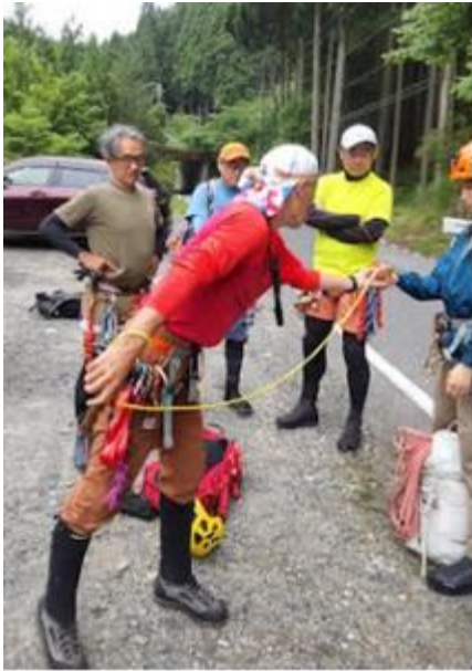
入渓前の基本説明