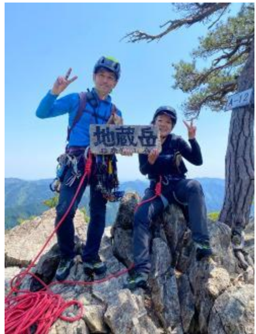
クライミングを終えて