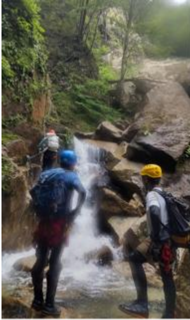
トップを引く講習生を見守る