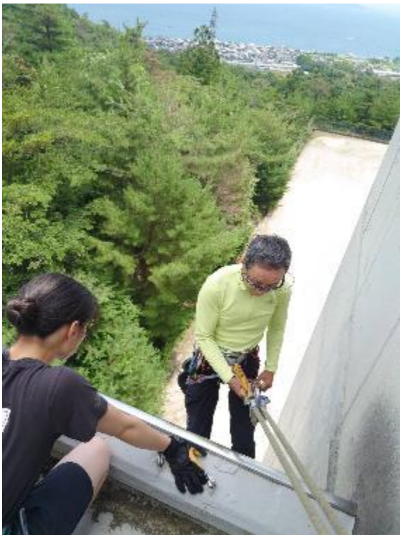
実技講習を熱心に学ぶ