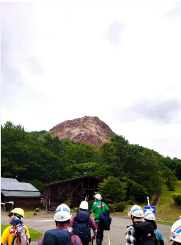
隆起した溶岩ドーム

昭和新山は1943年12月の有感地震を契機に突如として麦畑から隆起して誕生した溶岩ドームである。