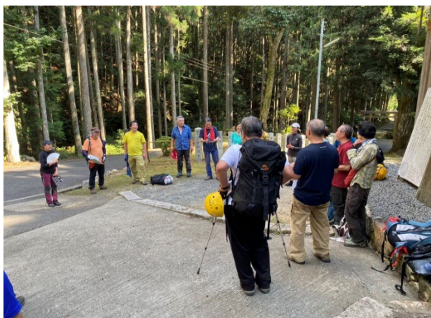
江文神社前で挨拶

バス組の参加メンバーが、戸寺のバス停前9時17分着で下車。そして車組の京都・滋賀支部メンバーが江文神社までピストンにて3往復し神社前に集合した。