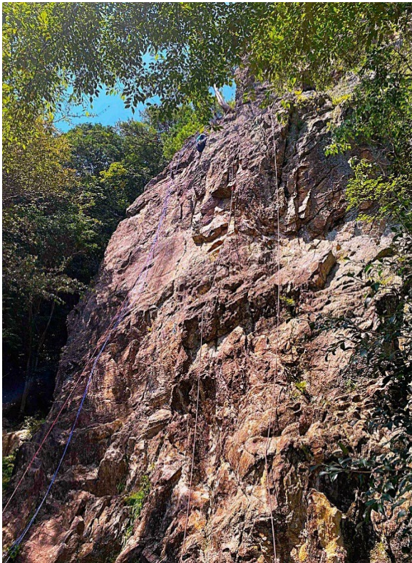
「ホワイトチムニー」 各ルートにロープをセットして登る

チムニールート、サラワリ、コーナハングにロープをセットしてみんなでワイワイ登りました。終始日当たりがよく暑かったですが、木陰に入ると谷からの風が気持ちよかったです。14時30分江文神社に下山、登山組と合流して無事に交流山行を終えました。